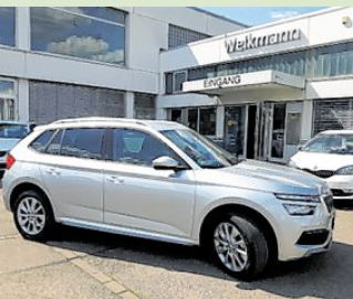
Skoda Kamiq G-TEC, CNG-Vorführer erhältlich bei Autohaus Weikmann in Illertissen.

VW: up!, Polo, Caddy, Golf und Golf Variant