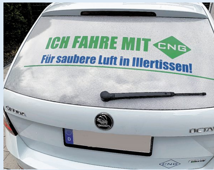
„Ich fahre mit CNG – Für saubere Luft in Illertissen“ – jetzt sauber und kostengünstig Auto fahren.

Am Anfang noch mit Erdgas wird bereits seit Anfang 2020 an der Gas-Zapfsäule erneuerbares Biomethan, umgangssprachlich BioCNG, abgegeben. Und das ist vor allem sehr sauber, kostengünstig und nachhaltig, denn es wird aus Reststoffen erzeugt. Das Biomethan/BioCNG wird mit einem Druck von 200 bar komprimiert an der Tankstelle zur